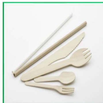
エコ素材の食器提供 (ストロー・スプーン)