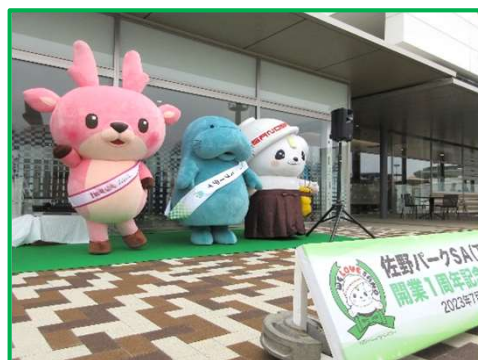
イベントでの自治体や地元企業等の公式キャラクターグリーティング

ご当地メニューや特産品等を対象としたフェア・イベント等の開催や自治体や地元企業と連携した地域商材の積極的な導入を推進しております。