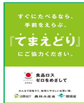
「てまえどり」運動の実施