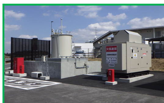
停電対策用発電機